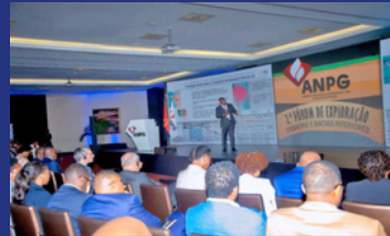
Exploration Forum 2025 – Onshore and Inland Basins “Angola Moving Inland with Strategic Vision and Sustainable Commitment