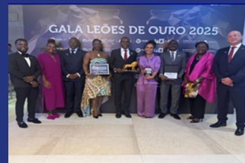
InFILDA 2025 Awarded, for the first time, the Golden Lion prize in the category of Best Participation in the Oil & Gas sector investor Call Discussion of Etu Energias' strategic opportunities and growth outlook;