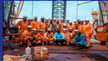
Block 2/05 Asset Receives SMS-ESSA Rig Block 2/05 Redevelopment Project