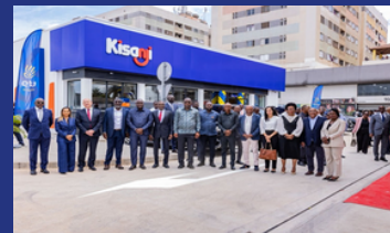
PA CUCA Innauguration Discussion of Etu Energias' strategic opportunities and growth outlook;