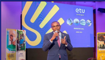
Investor Call Discussion of Etu Energias' strategic opportunities and growth outlook;