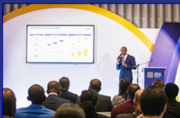
African Energy Week 2025 “Investing in African Energies”