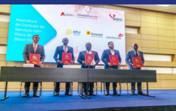
InSigning of the Risk Service Contract for Block CON 4 Leadership position in the energy sector investor Call Discussion of Etu Energias' strategic opportunities and growth outlook;